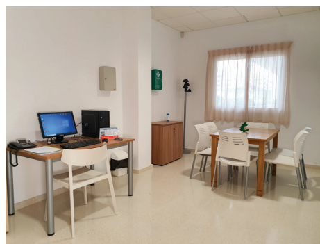
Sala de cuidadores