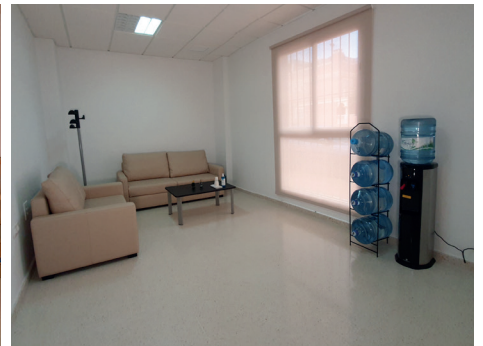
Sala de espera