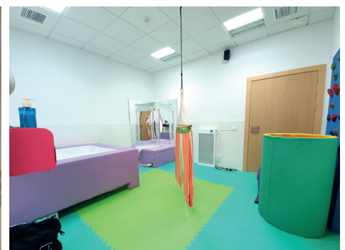
Sala de estimulación