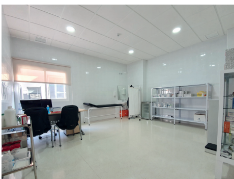
Sala de enfermería